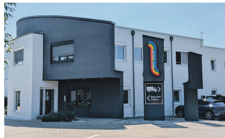
Von dem modernen Firmengelände am Bindlacher Berg aus vertreibt SW Color Lacke und Einfärbepasten nach ganz Europa.

Dabei wurde stets großer Wert auf die Ausbildung gelegt. Bereits mehrfach wurden Auszubildende von SW color für ihre Leistungen als Jahrgangsbeste prämiert. „Eine Übernahme nach der Ausbildungszeit ist auf jeden Fall angestrebt“, betont Katharina Bär, die selbst nach ihrer Ausbildung im Unternehmen geblieben ist und dort neben der spannenden